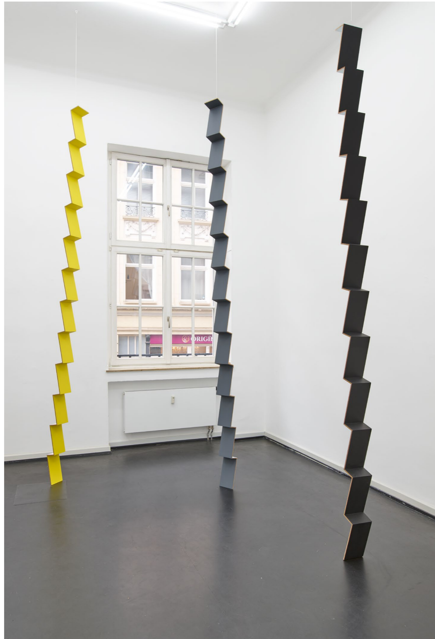
Steps , 2024 Acrylic and oil paint on MDF 3 x ca. 352 x 14,6 x 10 cm EUR 25.000 (incl. VAT)