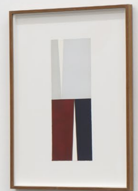
Martin Gerwers Ascending Descending Installation View