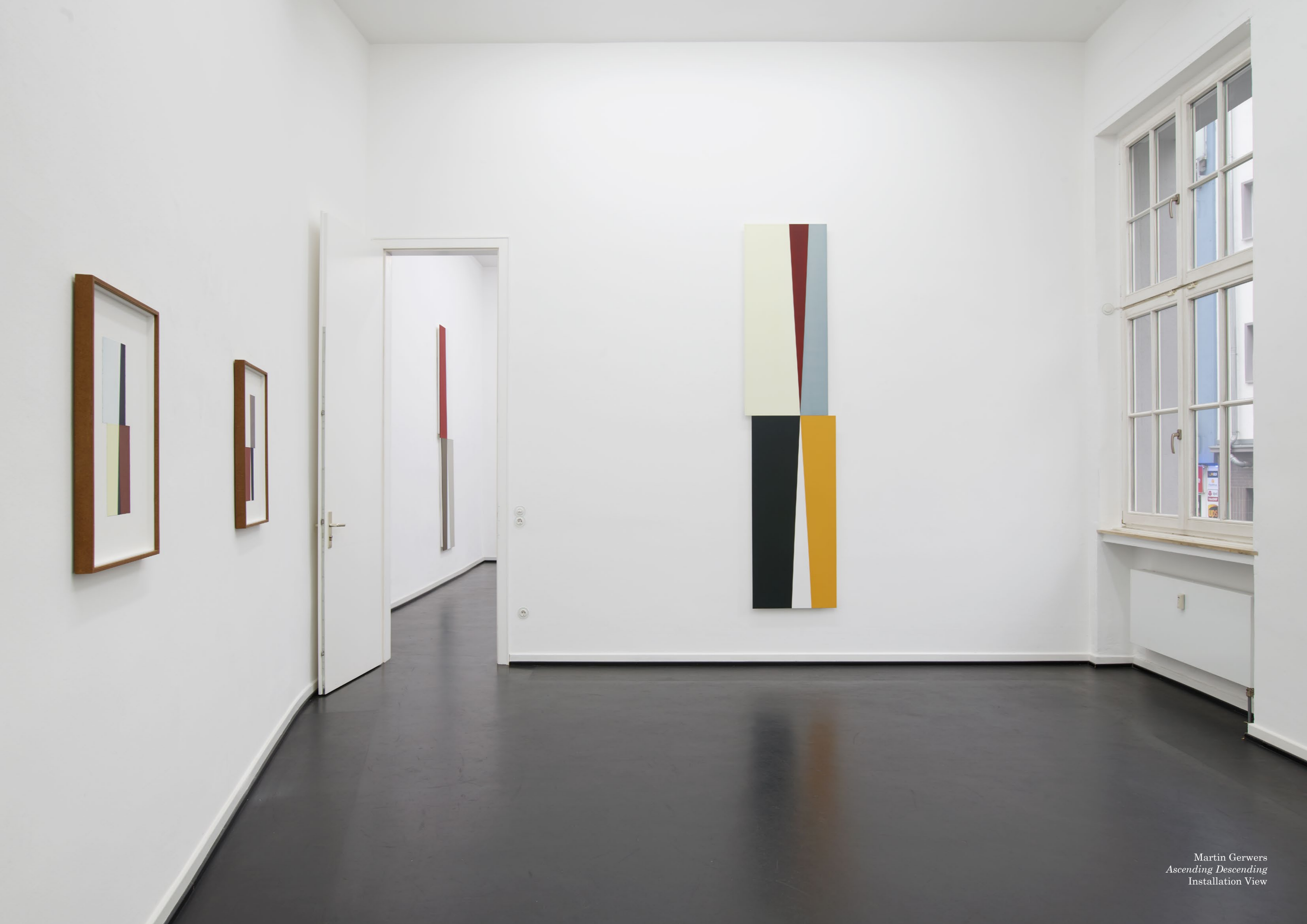
Martin Gerwers Ascending Descending Installation View