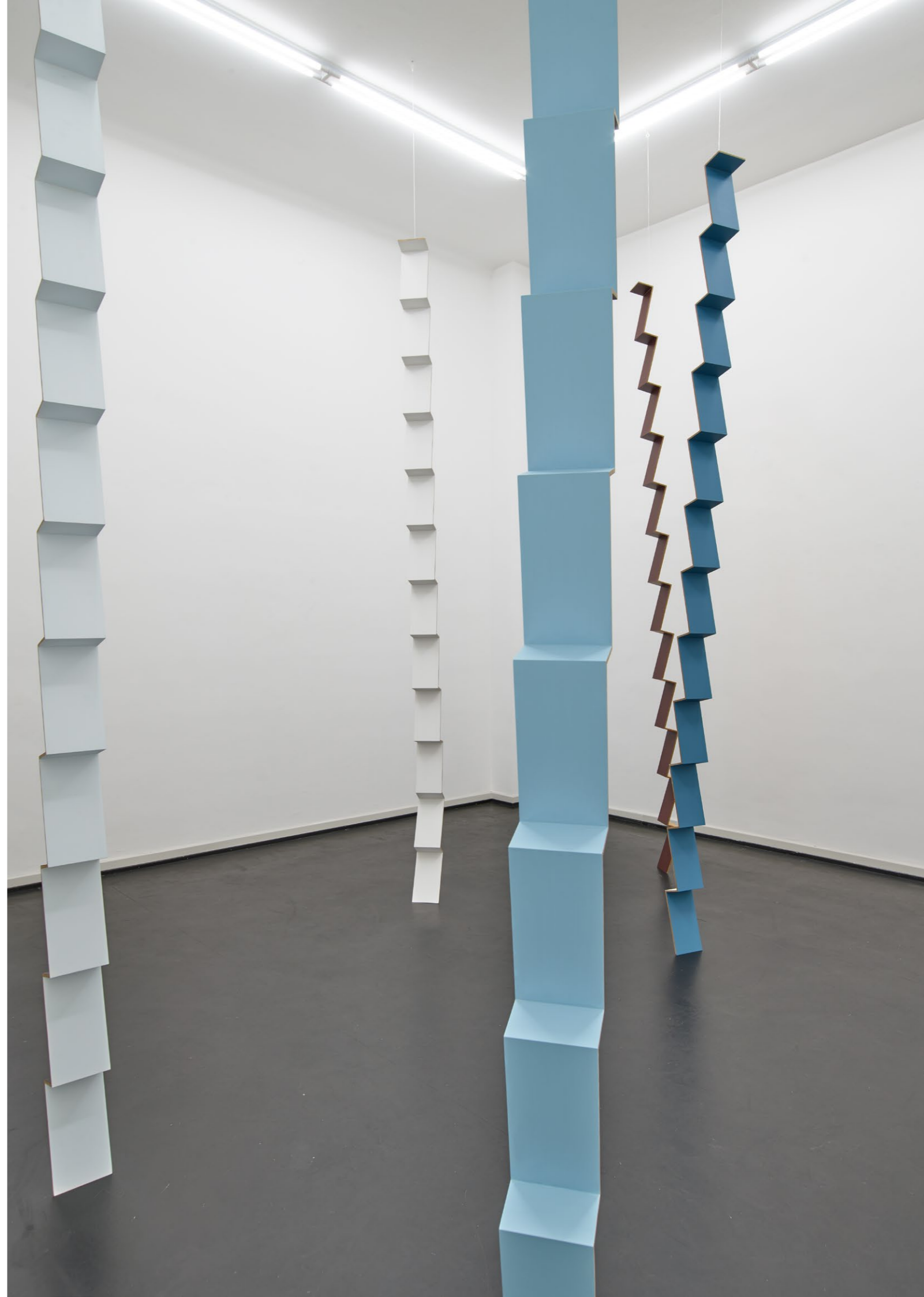
Martin Gerwers Ascending Descending Installation views