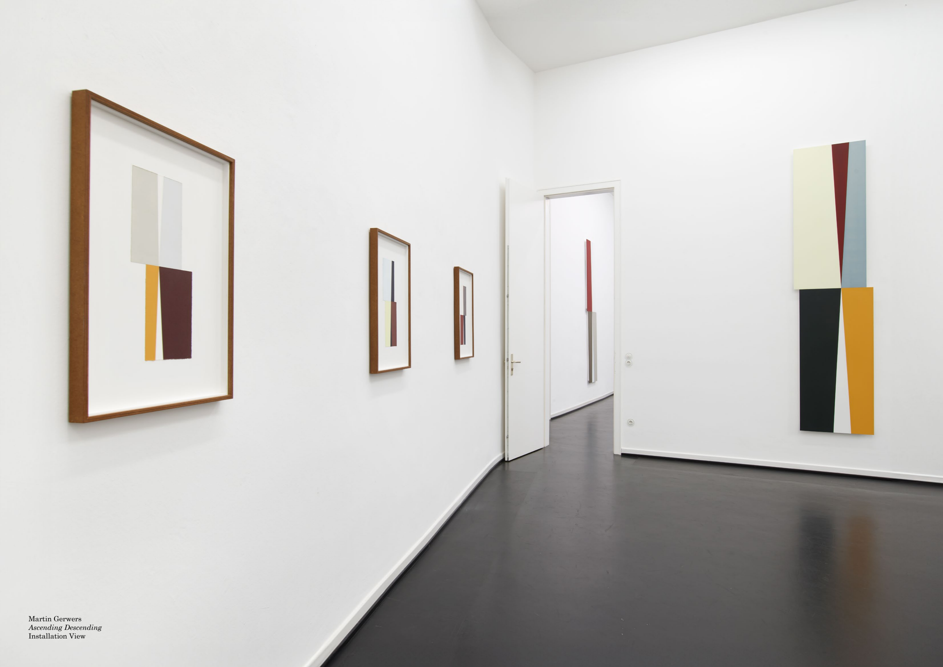
Martin Gerwers Ascending Descending Installation View