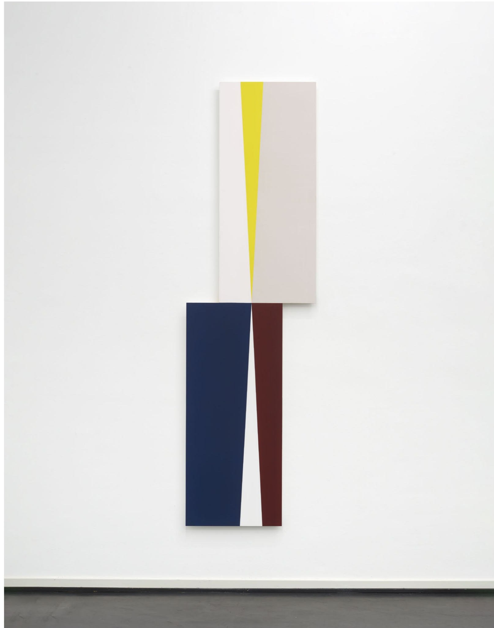
Center 2 , 2024 Acrylic and oil paint on MDF 274 x 79,5 cm EUR 16.000 (incl. VAT)