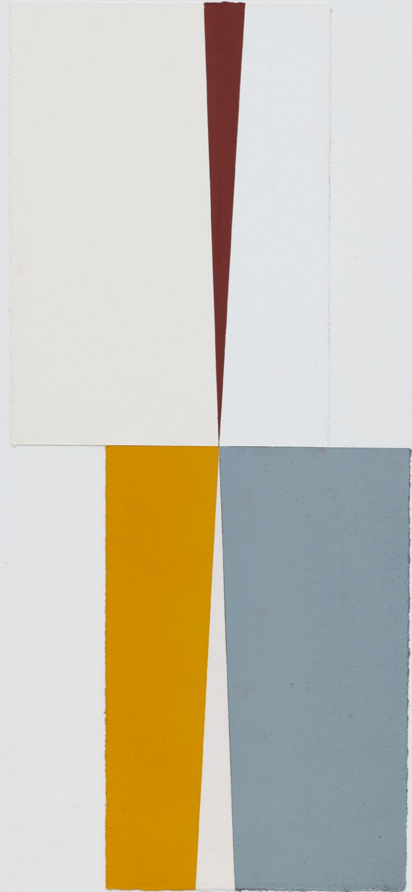
Untitled (August 2024, No. 5) , 2024 Detail