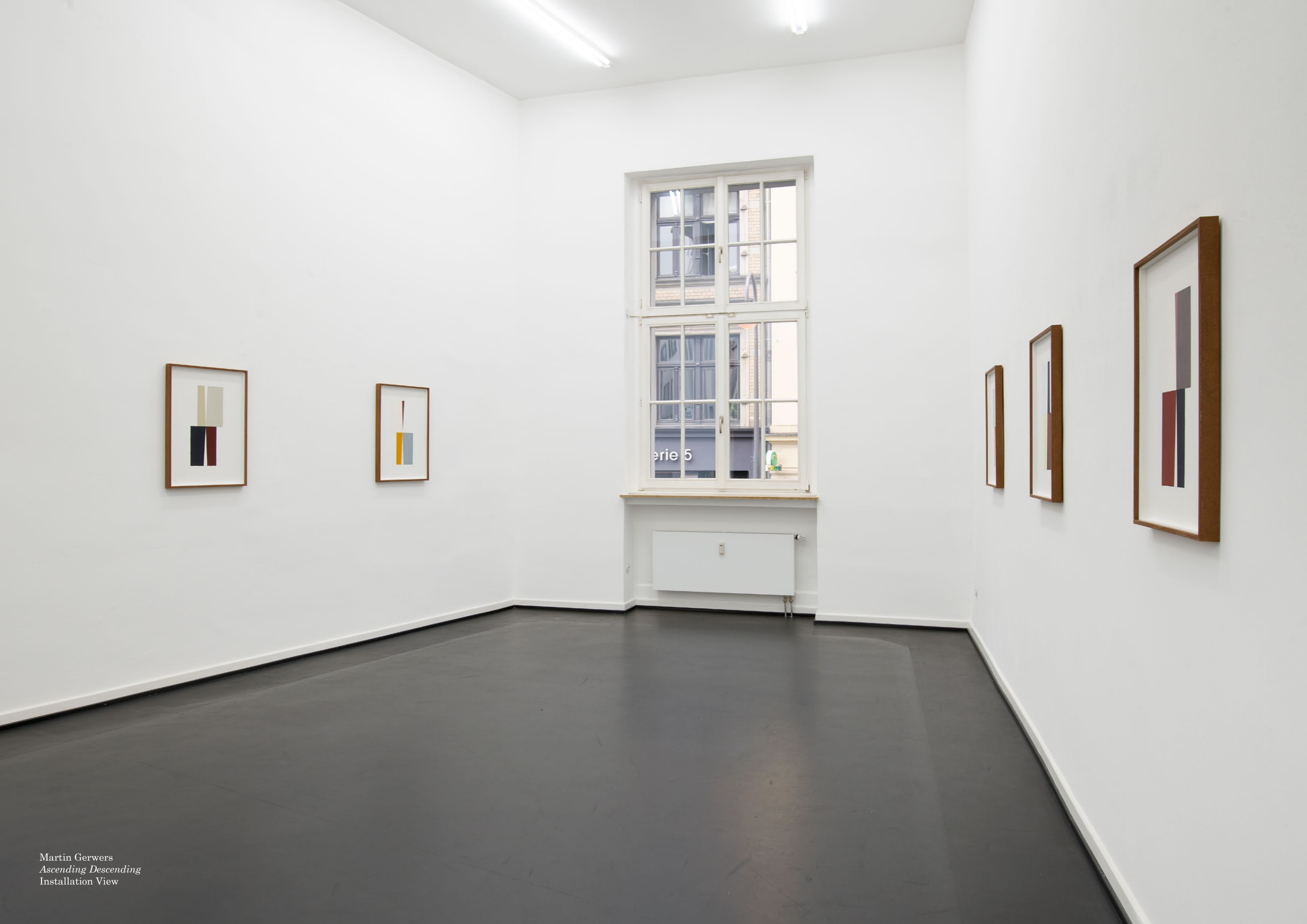
Martin Gerwers Ascending Descending Installation View