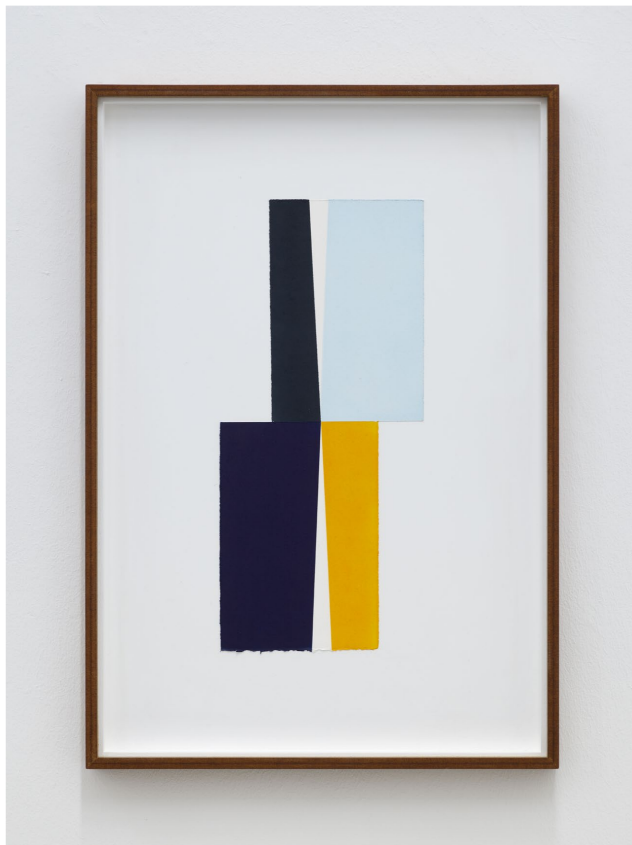
Untitled (Paper, No. 1) , 2024 Oil paint on paper, laid down on MDF 71,2 x 49,2 cm (frame size) EUR 3.000 (incl. VAT)