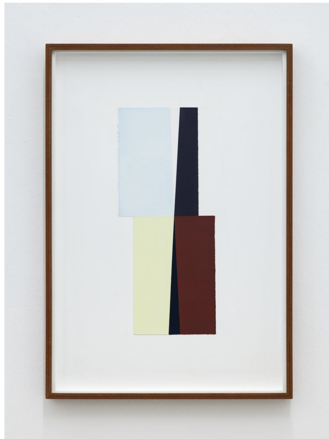
Untitled (July 2024, No. 3) , 2024 Oil and acrylic paint on paper, laid down on MDF 71,2 x 49,2 cm (frame size) EUR 3.000 (incl. VAT)