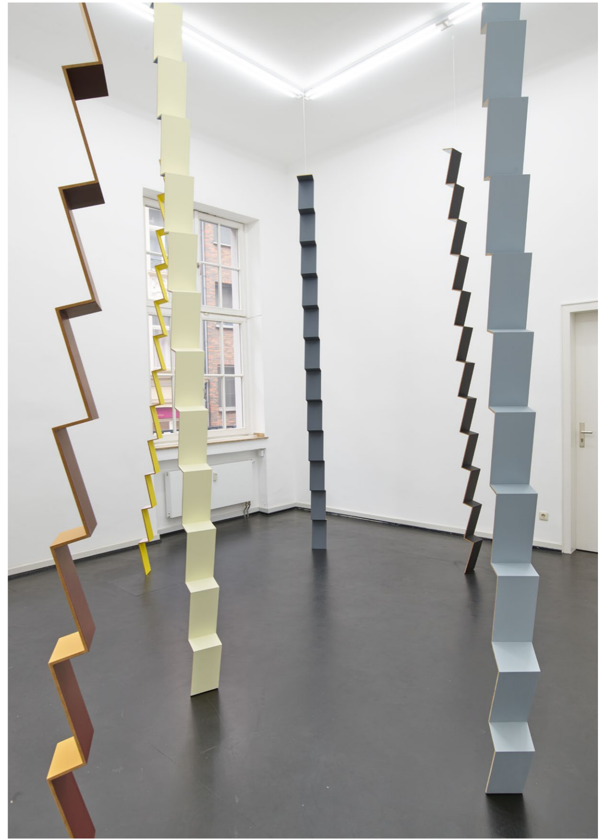
Martin Gerwers Ascending Descending Installation views