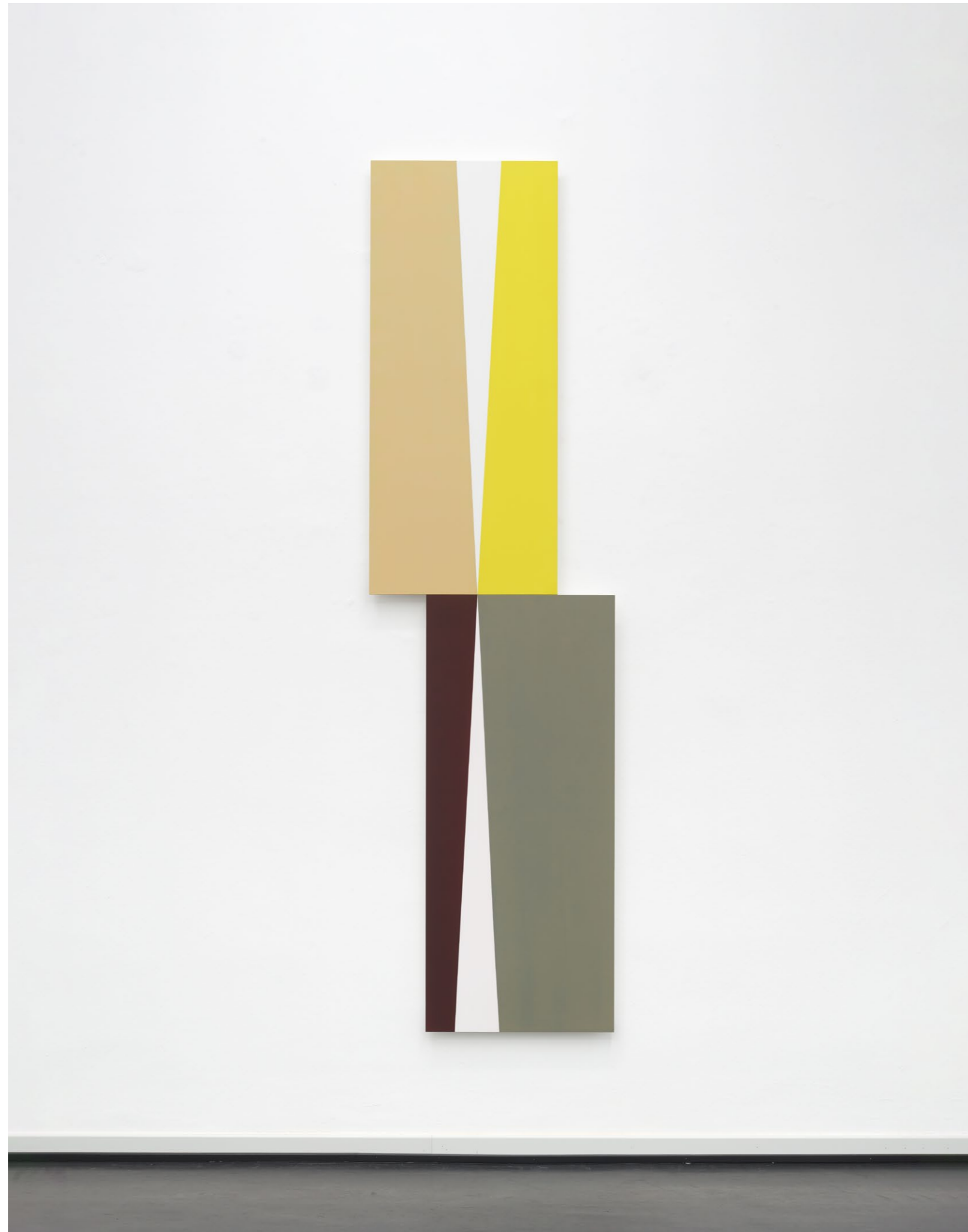
Center 3 , 2024 Acrylic and oil paint on MDF 274 x 77,2 cm EUR 16.000 (incl. VAT)