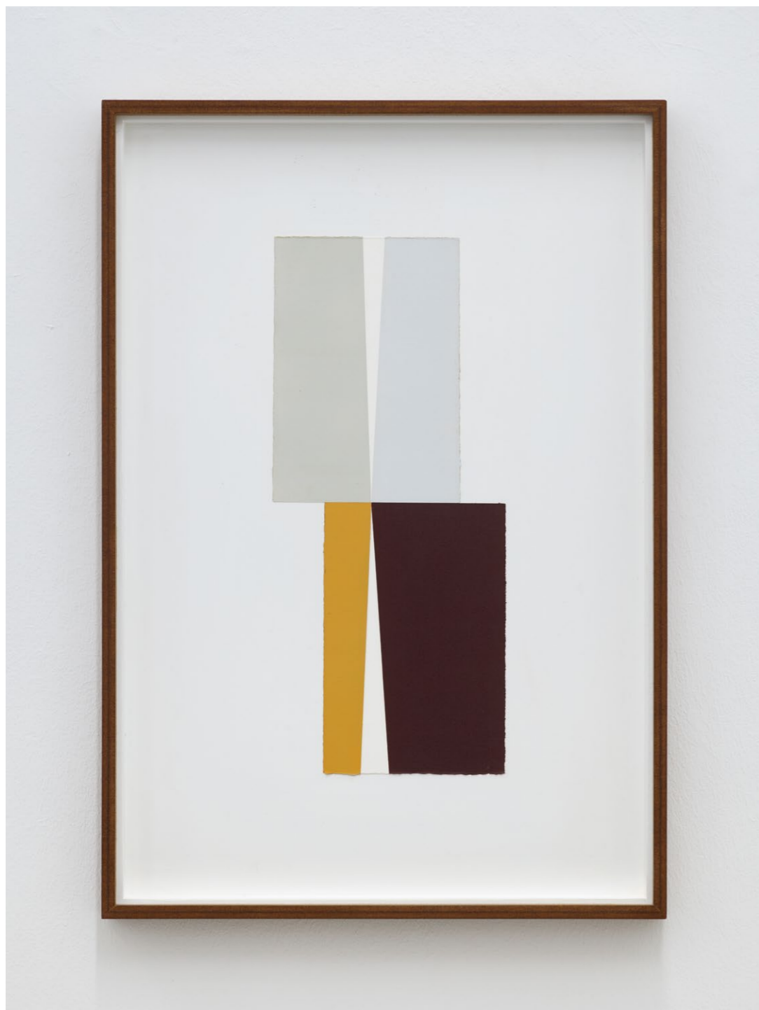
Untitled (July 2024, No. 2) , 2024 Oil and acrylic paint on paper, laid down on MDF 71,2 x 49,2 cm (frame size) EUR 3.000 (incl. VAT)