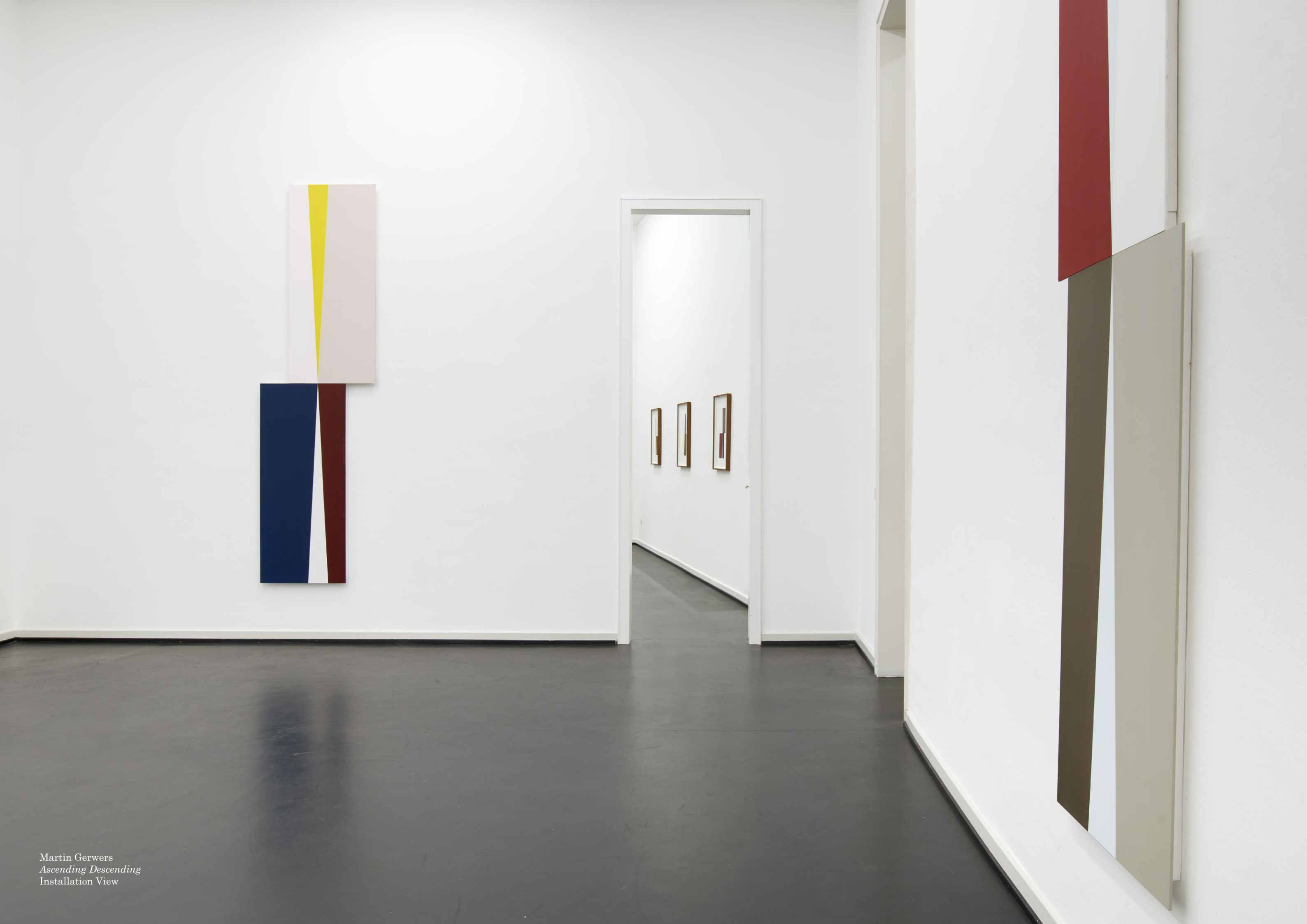
Martin Gerwers Ascending Descending Installation View