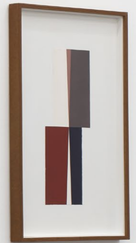
Martin Gerwers Ascending Descending Installation View