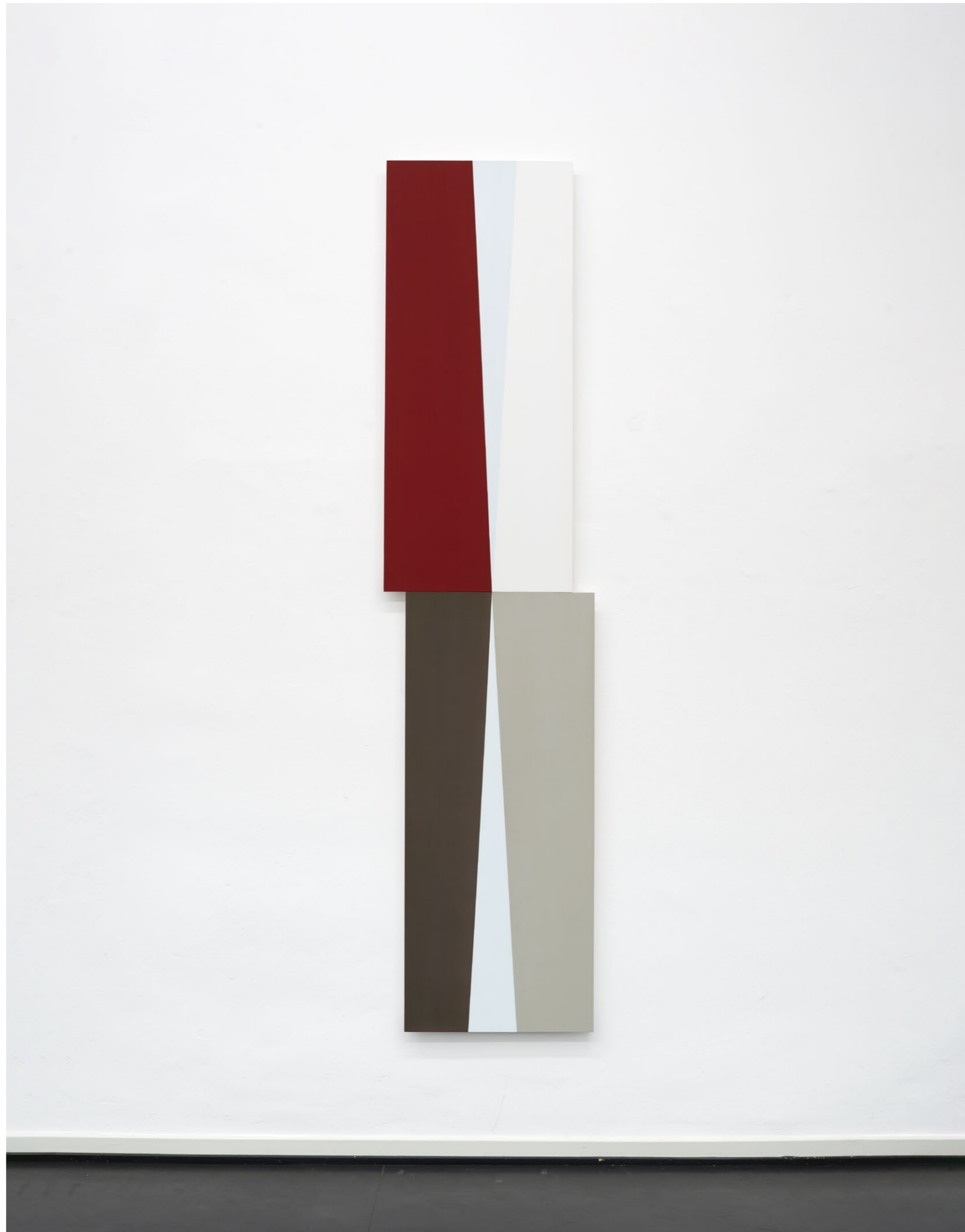
Center 1 , 2024 Acrylic and oil paint on MDF 274 x 66,1 cm EUR 16.000 (incl. VAT)