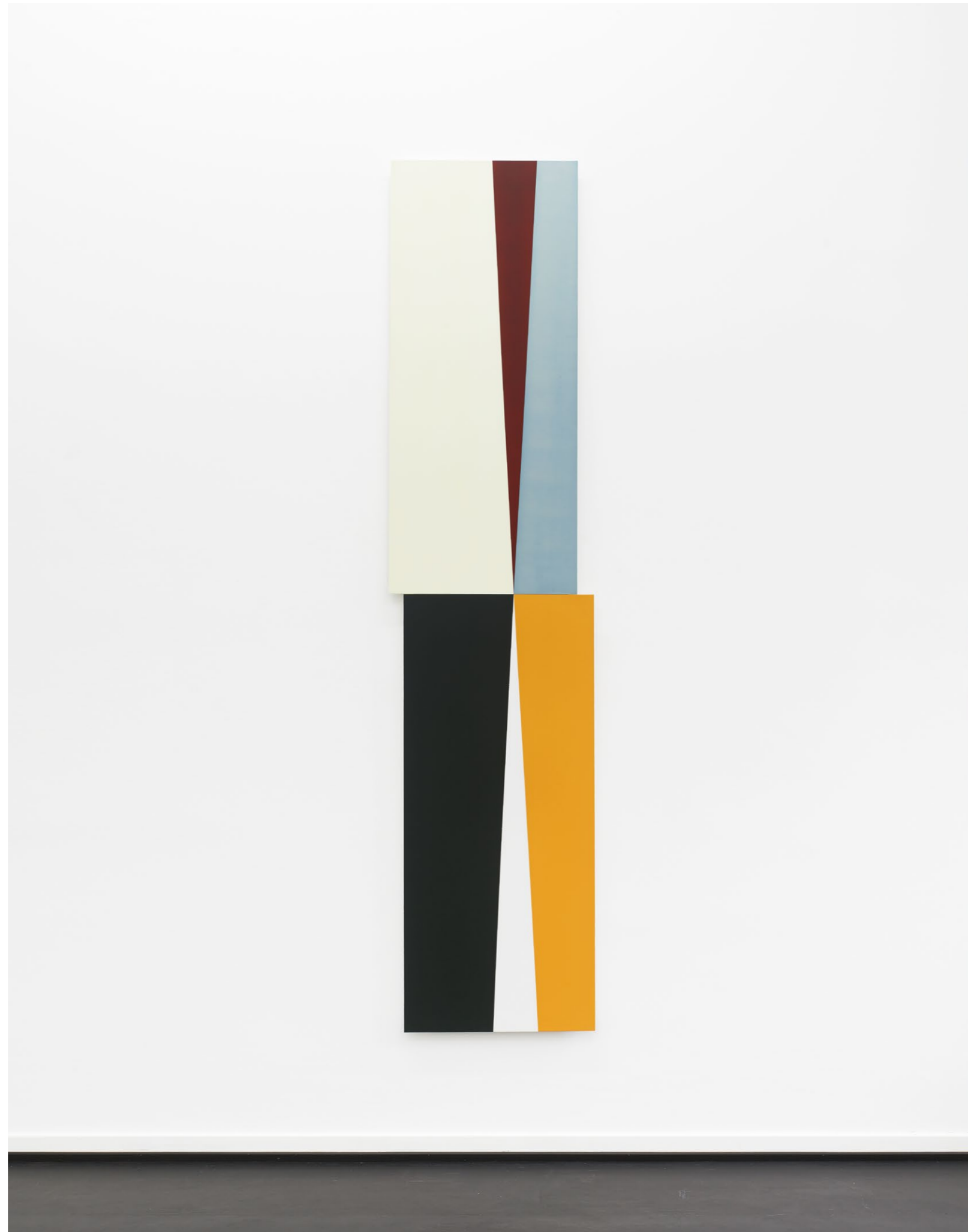
Center 4, 2024 Acrylic and oil paint on MDF 274 x 64,6 cm EUR 16.000 (incl. VAT)