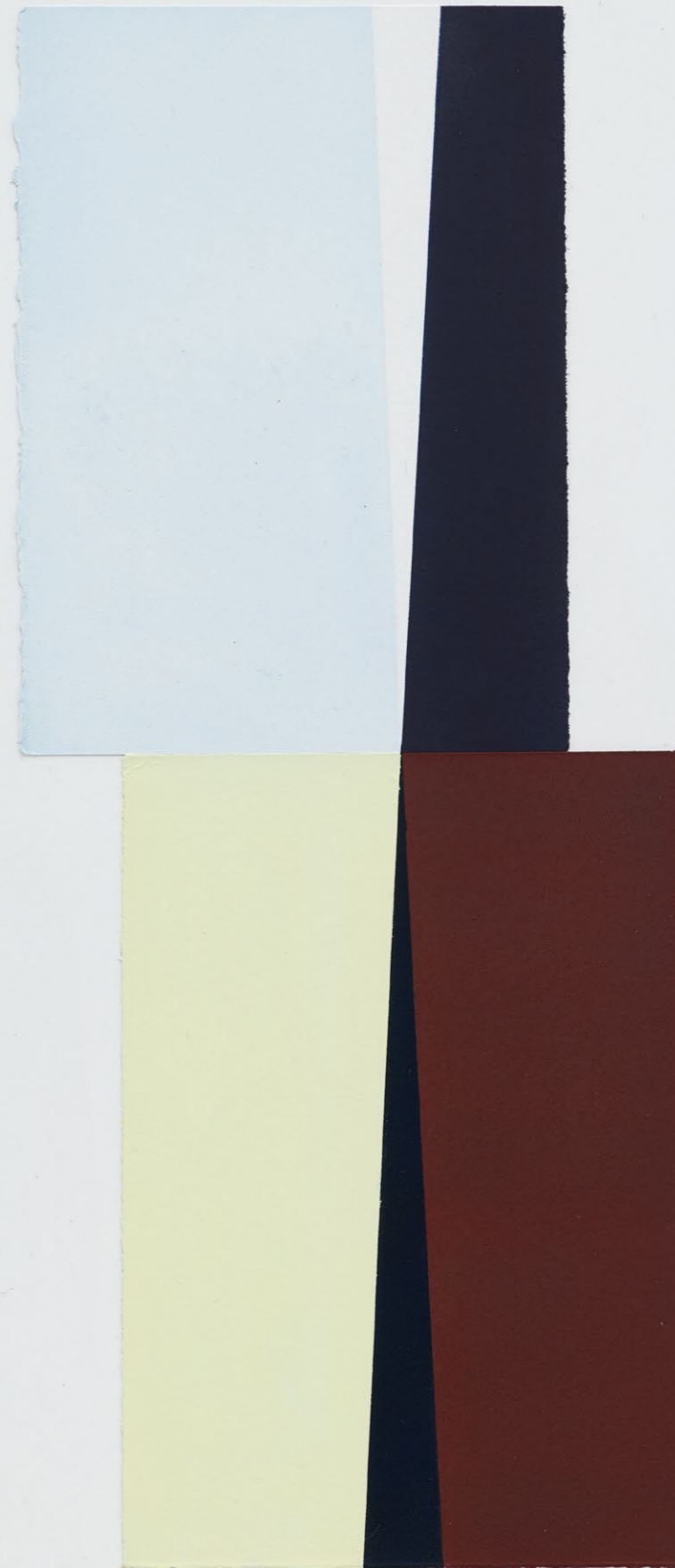
Untitled (July 2024, No. 3) , 2024 Detail