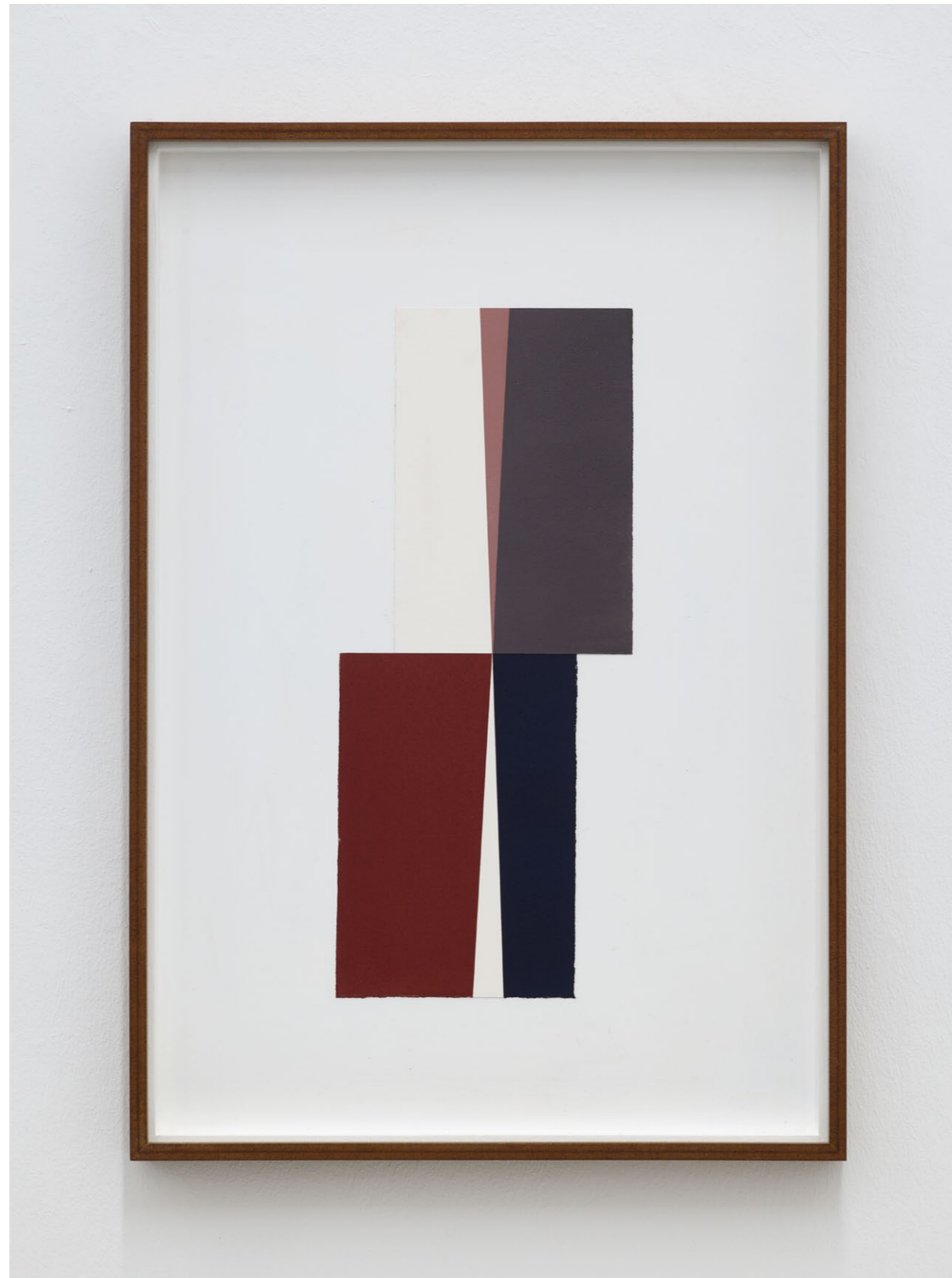
Untitled (August 2024, No. 7) , 2024 Oil paint on paper, laid down on MDF 71,2 x 49,2 cm (frame size) EUR 3.000 (incl. VAT)