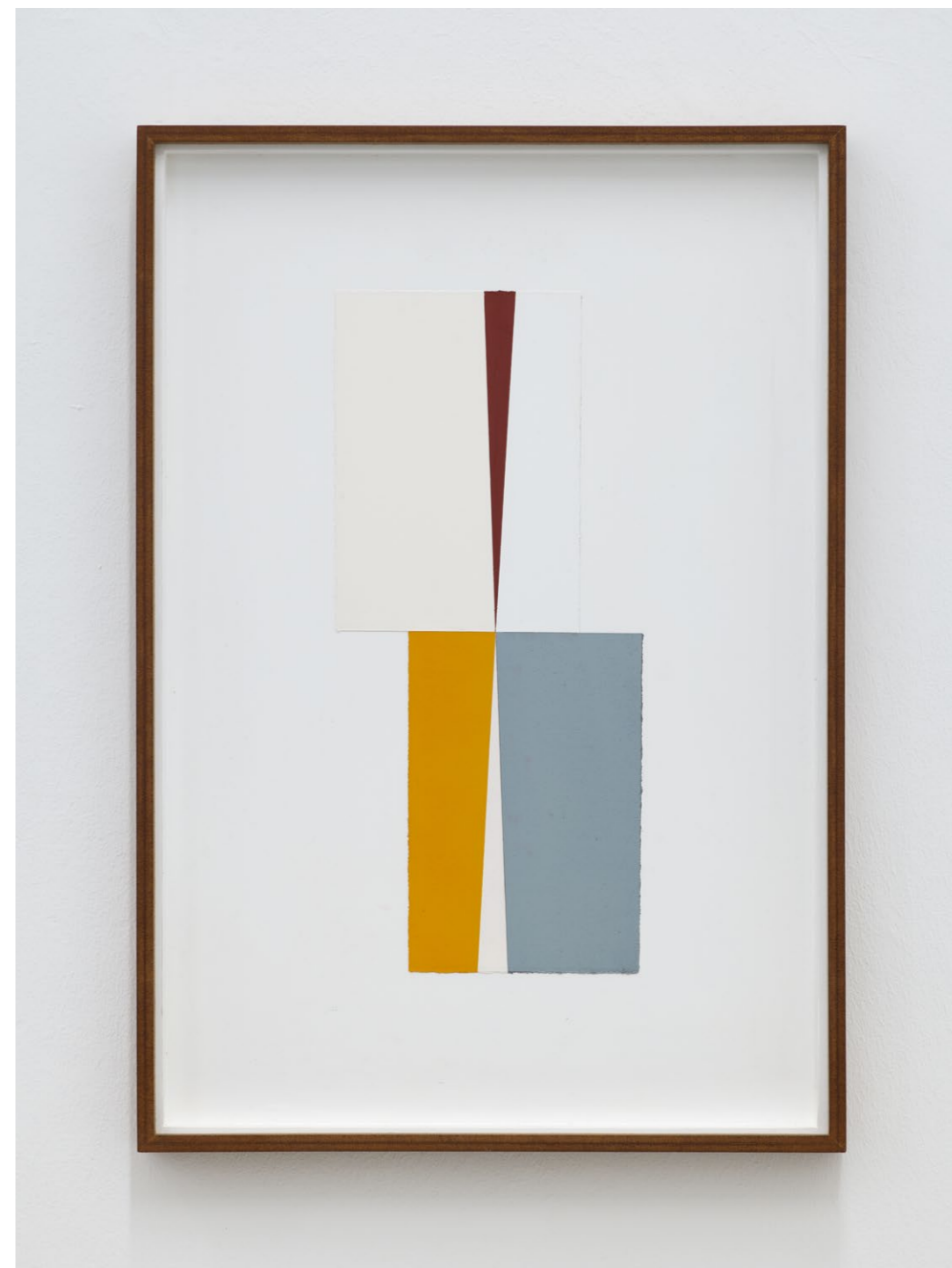
Untitled (August 2024, No. 5) , 2024 Oil and acrylic paint on paper, laid down on MDF 71,2 x 49,2 cm (frame size) EUR 3.000 (incl. VAT)