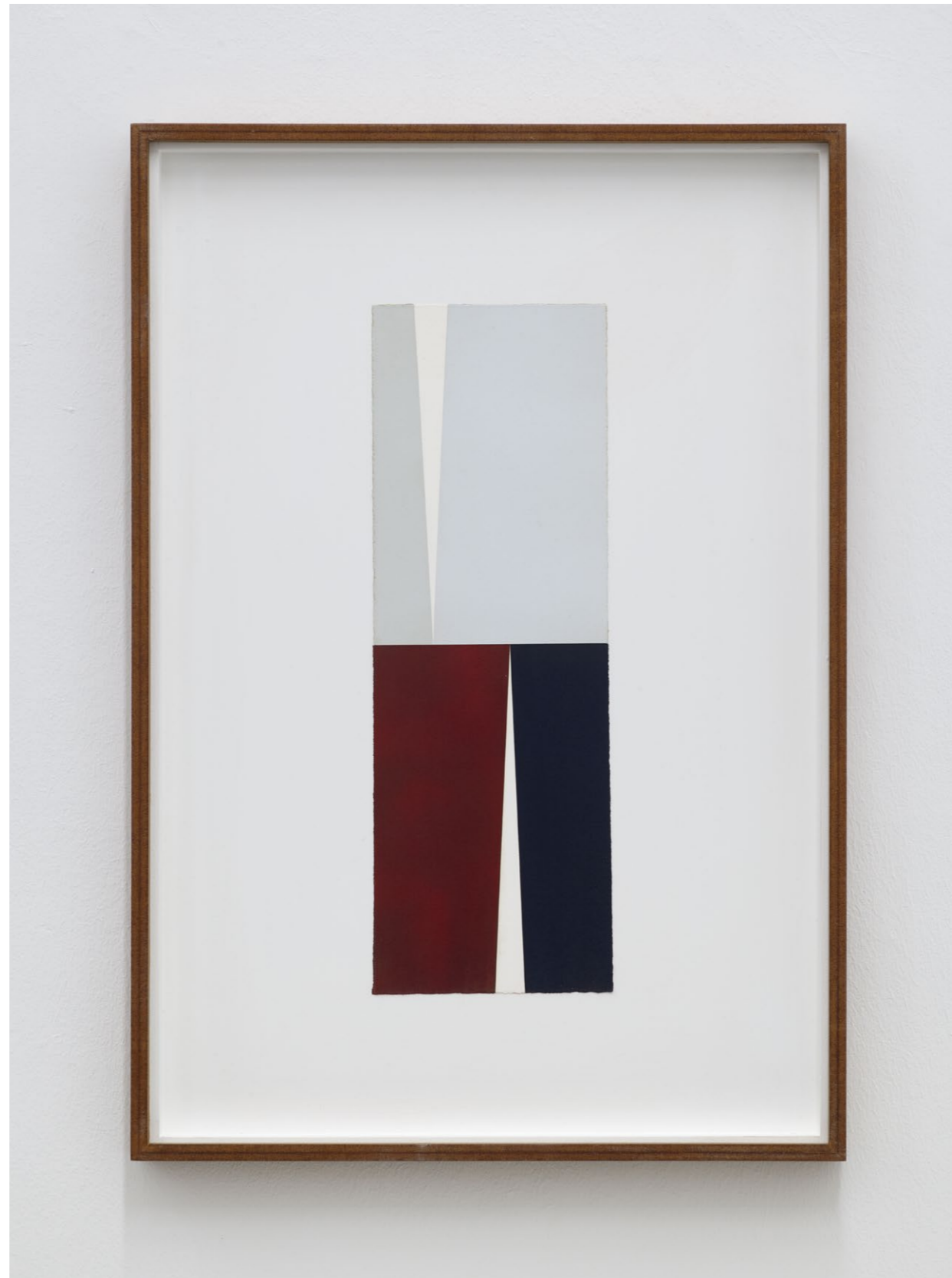
Untitled (July 2024, No. 4) , 2024 Oil and acrylic paint on paper, laid down on MDF 71,2 x 49,2 cm (frame size) EUR 3.000 (incl. VAT)