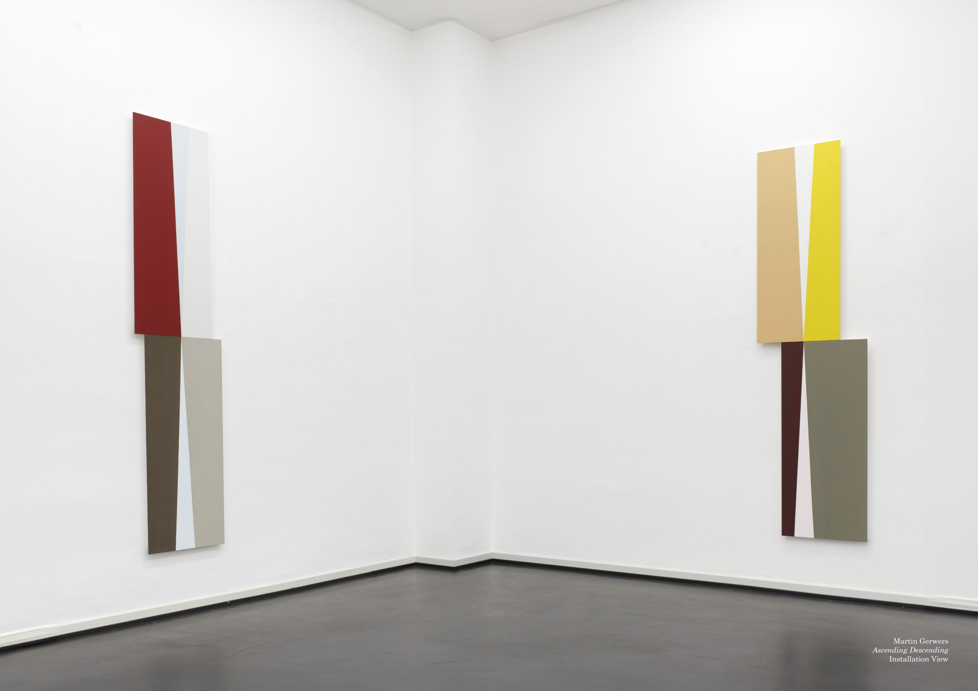
Martin Gerwers Ascending Descending Installation View