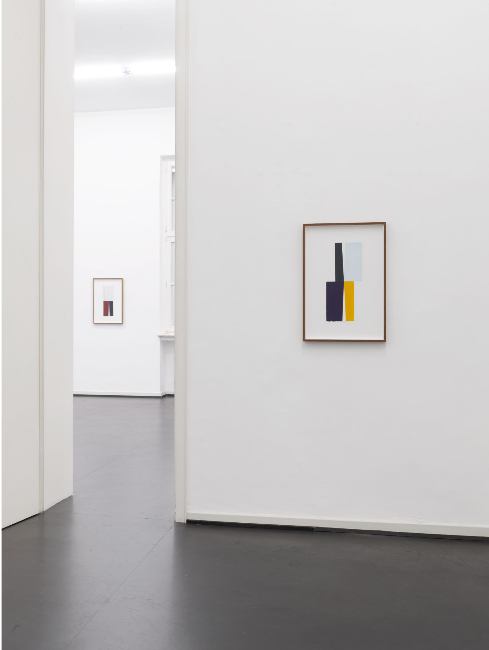
Martin Gerwers Ascending Descending Installation View