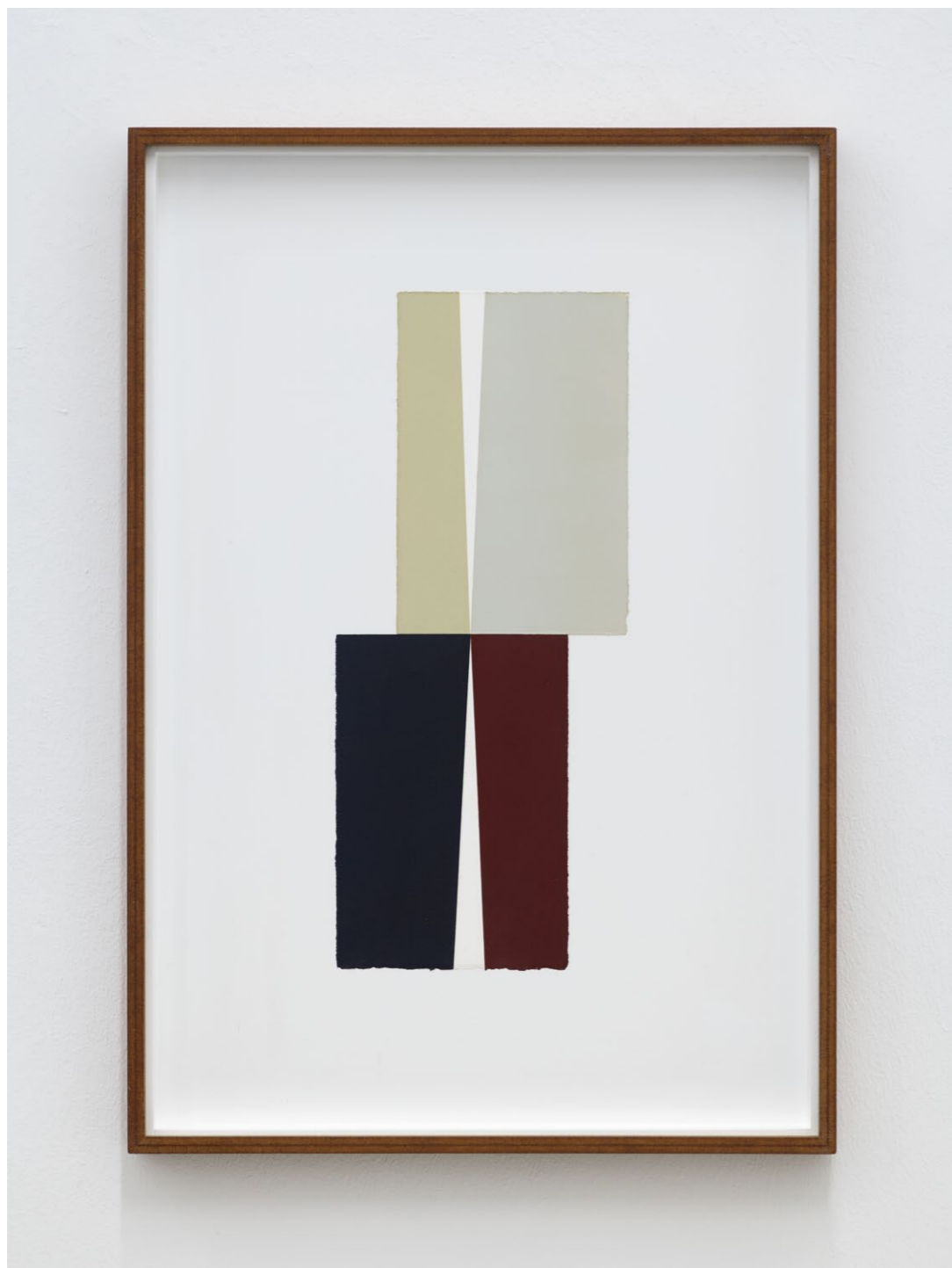
Untitled (August 2024, No. 6) , 2024 Oil and acrylic paint on paper, laid down on MDF 71,2 x 49,2 cm (frame size) EUR 3.000 (incl. VAT)