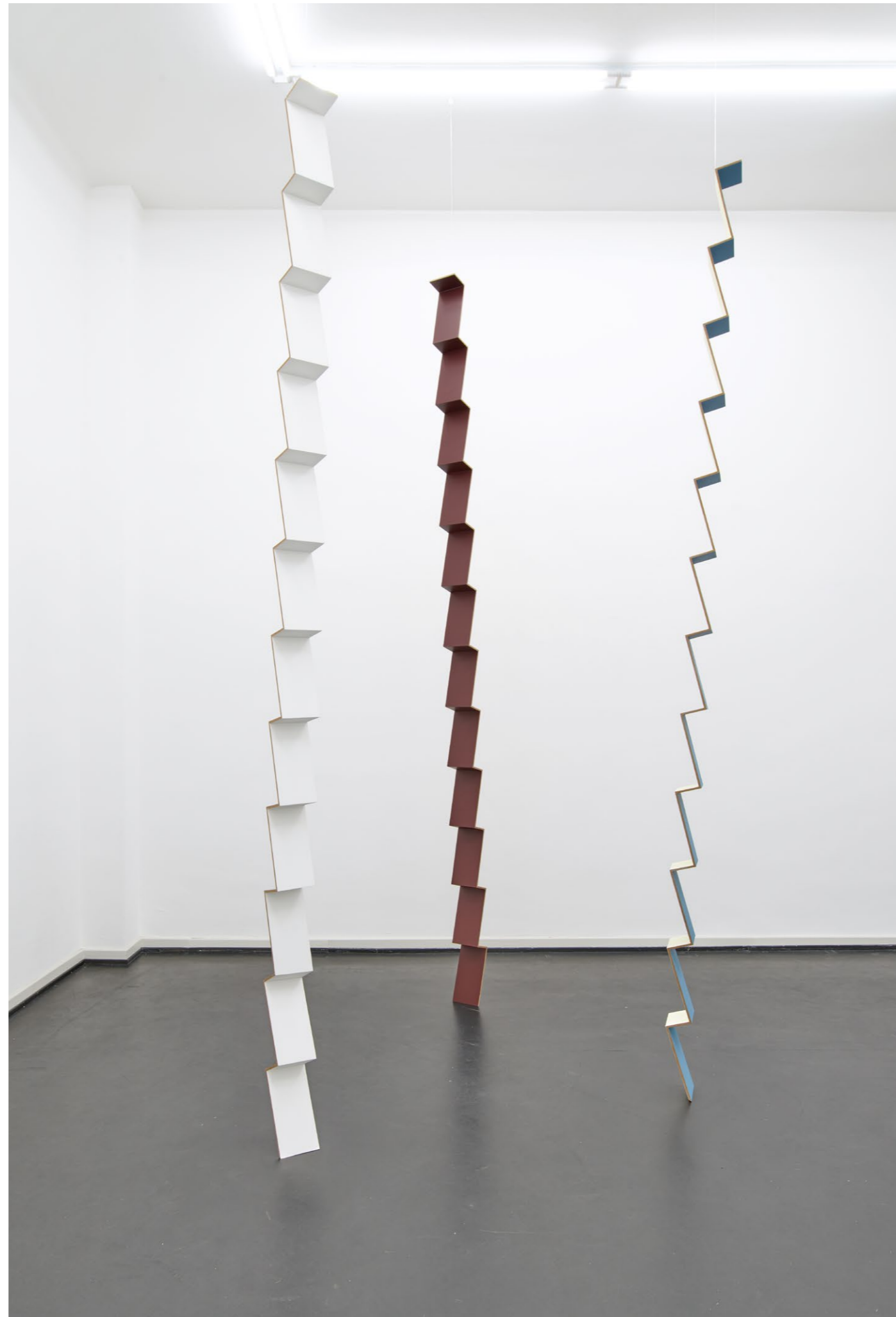
Steps , 2024 Acrylic and oil paint on MDF 3 x ca. 352 x 14,6 x 10 cm EUR 25.000 (incl. VAT)