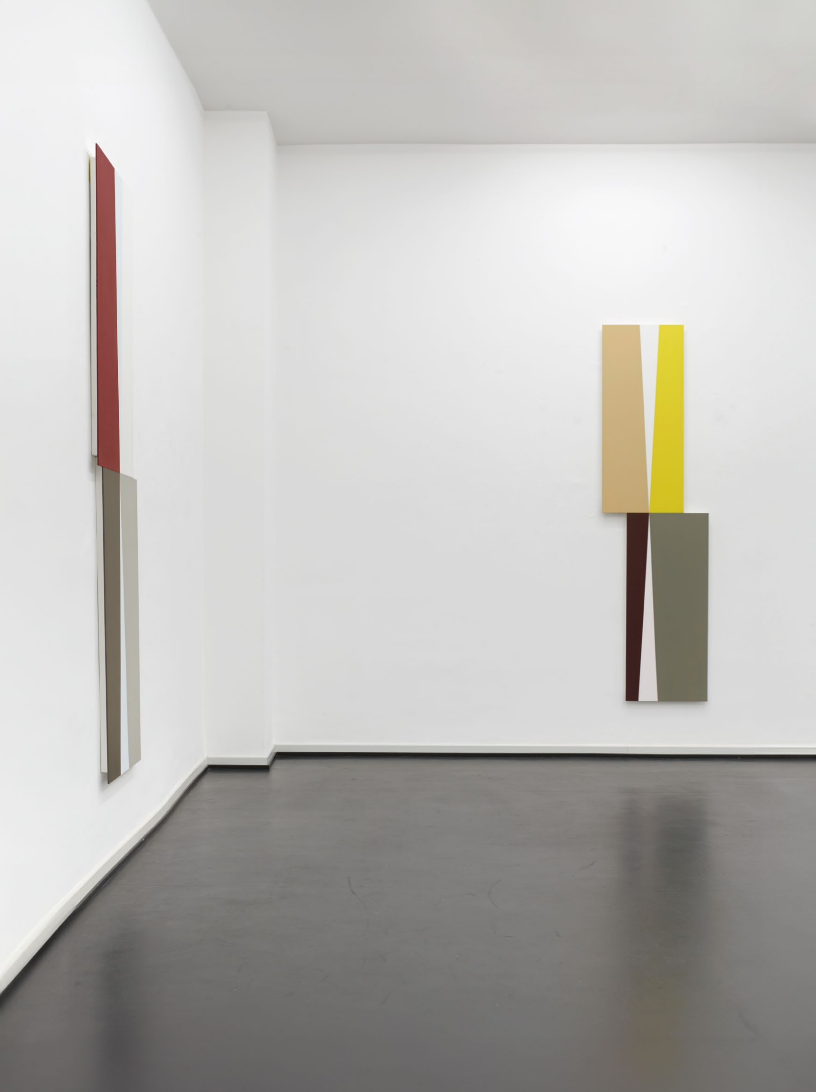
Martin Gerwers Ascending Descending Installation View